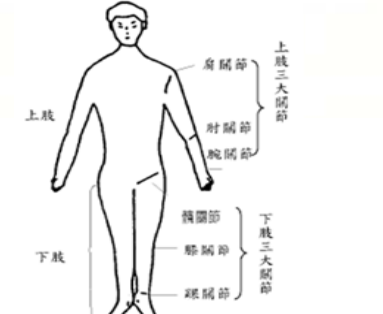
(2) 上、下肢關節生理運動範圍一覽表